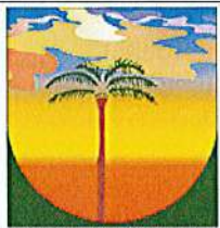
LA PLAINE DES PALMISTES